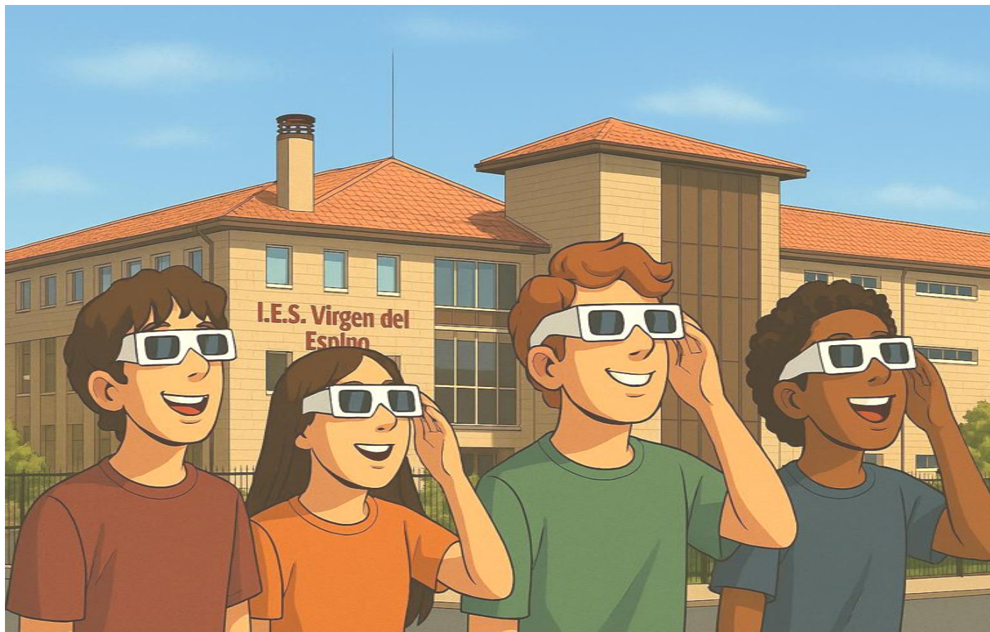
Ilustración de jóvenes observando de forma segura un eclipse solar frente al I.E.S. Virgen del Espino. / M365 Copilot (2026). [Imagen generada por IA]. Microsoft.